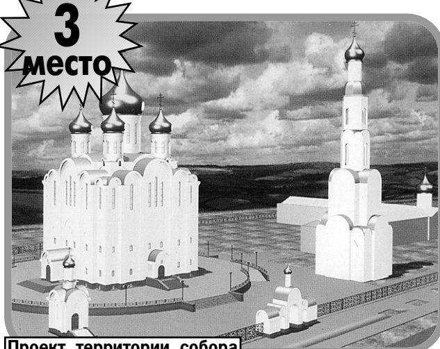
Проект территории собора с новой колокольней.

Одна из главных достопримечательностей города – не так давно ему присвоено звание Кафедрального собора Коми. Печально знаменит тем, что строители поспешили его достроить, не просчитав до конца конструкцию. Теперь все недочеты дают о себе знать – в куполе образовалась дыра, и каждые весну-осень главный православный храм нещадно заливает водой, при этом портятся и само здание, и роспись на стенах, которую делали специально приглашенные для этой работы болгарские специалисты.